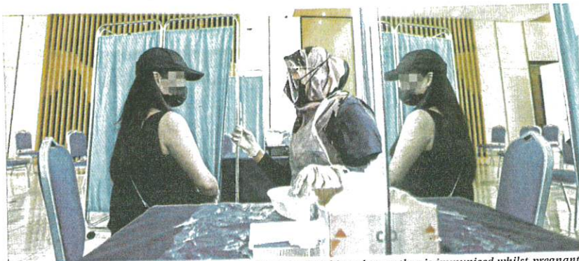
An unborn child is protected against harmful diseases when his or her mother is immunised whilst pregnant.

The incidences of pertussis have increased in recent times due to a