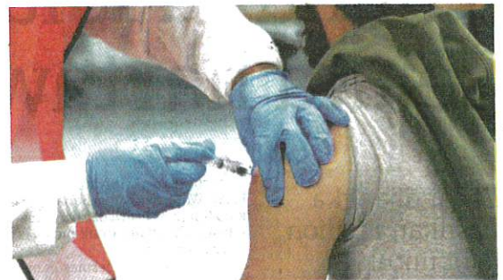
Daripada 51,000 korban COVID-19 di England antara Januari hingga Julai lalu, hanya 256 babitkan penerima vaksin lengkap. (Foto hiasan)

Selain itu, 0.5 peratus pula adalah mereka yang sudah lengkap divaksin, namun ujian saringan mendapati individu itu positif dalam tempoh 14 hari selepas dos kedua. AGENSI