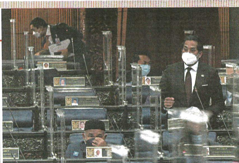
Health Minister Khairy Jamaluddin speaking in Parliament yesterday.