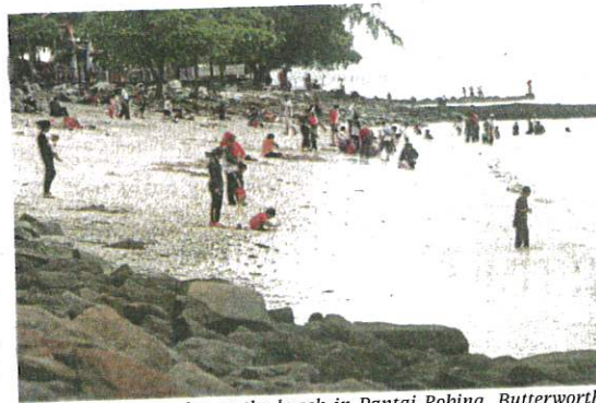
People enjoying a day at the beach in Pantai Robina, Butterworth, recently.

"The ministry is refining the vaccination process for teenagers aged 18 and below. Engagement