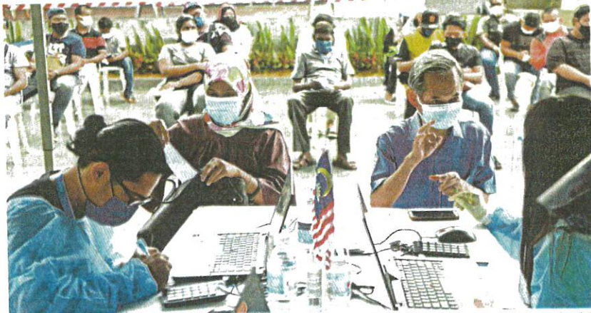
Penduduk di Lembah Klang boleh dapatkan suntikan vaksin secara walk-in mulai hari ini hingga 30 September ini. (Foto hiasan)

CITF berkata, individu yang menerima dos pertama di PPV yang ditutup di Hulu Selangor