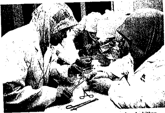
KERAJAAN memberi kemudahan kepada doktor kontrak melanjutkan pengajian kepakaran di universiti tempatan. - GAMBAR HIASAN

KUALA LUMPUR - Malaysia tidak mengalami masalah kekurangan bilangan doktor siswazah sebaliknya sedang berhadapan dengan kekurangan doktor pakar.