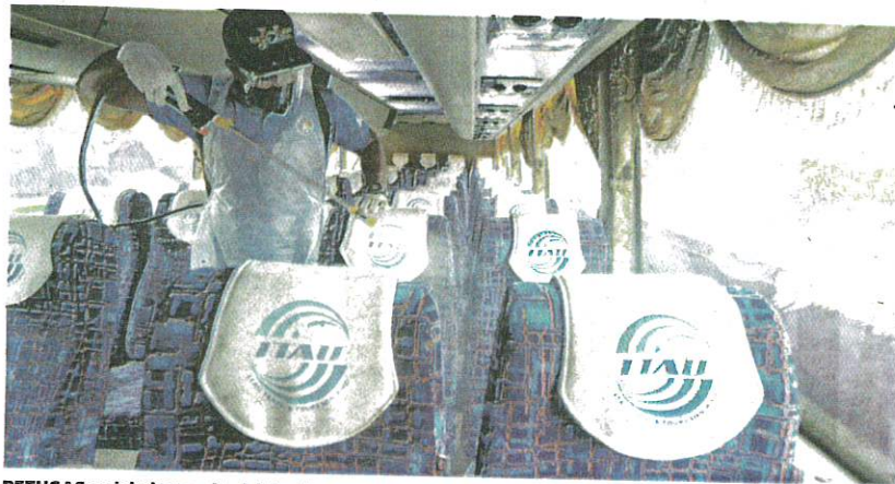
PETUGAS melakukan sanitasi dalam bas persiaran, semalam sebagai persediaan pembukaan semula Langkawi di bawah program gelembung pelancongan, hari ini.

"Pelancong juga boleh membeli kit ujian sendiri saliva melalui perkhidmatan yang disediakan pihak swasta di tempat saringan di lapangan terbang atau terminal feri dan menjalani ujian pengesanan di situ," katanya dalam satu