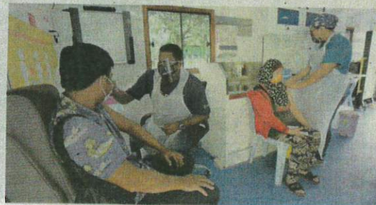
Selangor peruntukkan 50,000 dos vaksin bergerak di beberapa lokasi di negeri itu.

Beliau berkata, Ahli Dewan Undangan Negeri (ADUN) dan ahli Parlimen diminta untuk menjadi tuan rumah serta menyediakan senarai individu yang akan menerima vaksin pada hari program dilaksanakan.