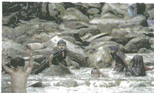
IBU bapa perlu berasa bimbang terhadap risiko jangkitan Covid-19 kepada anak-anak mereka sekiranya terdedah kepada tempat umum atau sesak.

Katanya, pengumuman kerajaan mengenai pembukaan sesi persekolahan menjelang Okto-