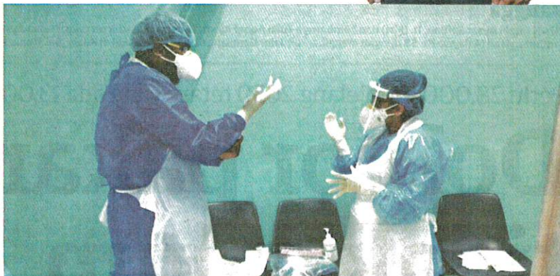
NEGARA memerlukan 28,000 doktor pakar menjelang 2030 tetapi ketika ini yang ada dalam sektor awam dan swasta kira-kira 13,000 orang.